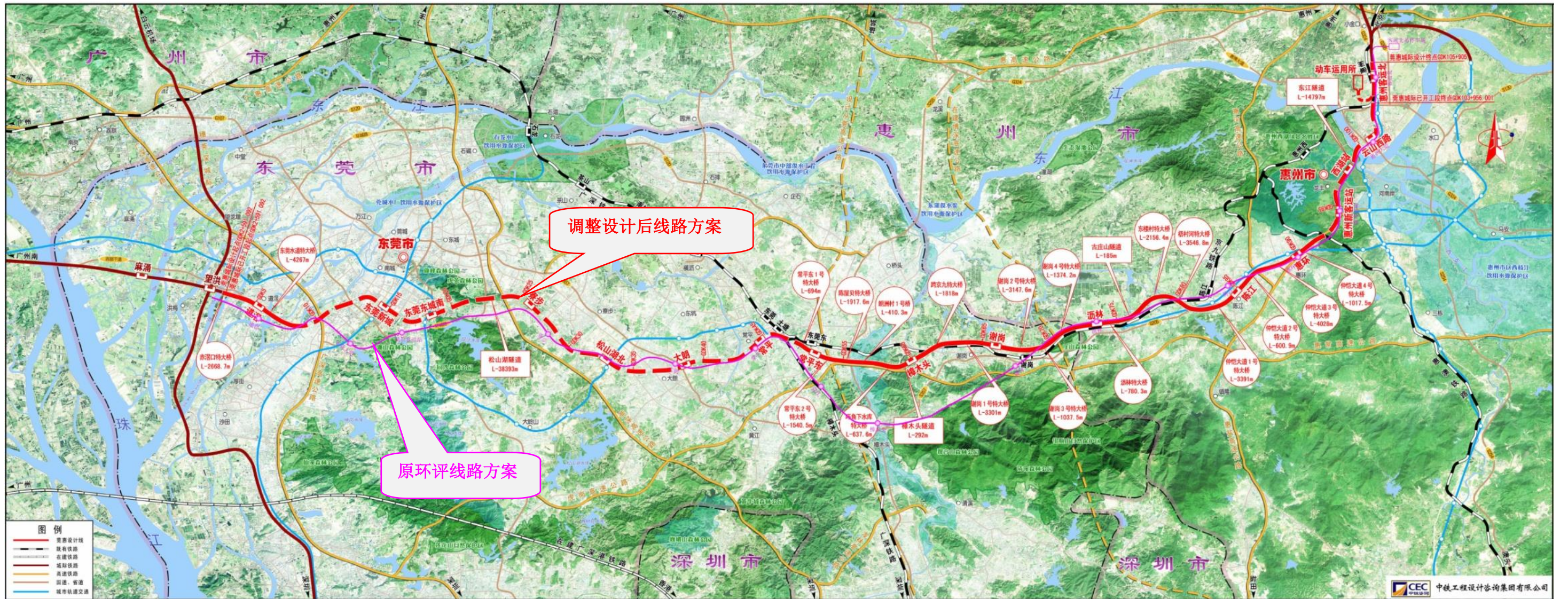
图 1.1-1 莞惠城际线路方案平面示意图